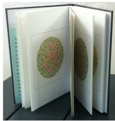
T21 : 14 planches