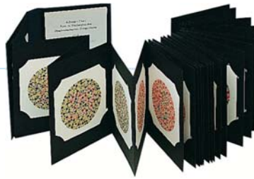
T22 : 38 planches