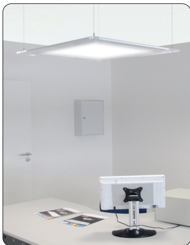
Support de suspension transparent